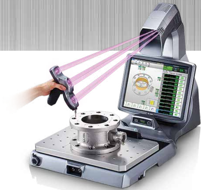
CMM : Keyence XM Model