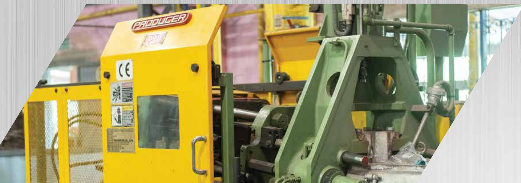
Producer 20 ton 1 set