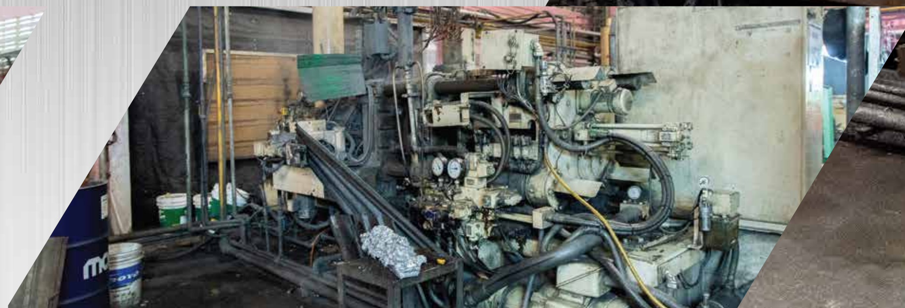
Toshiba 135 ton 2 sets