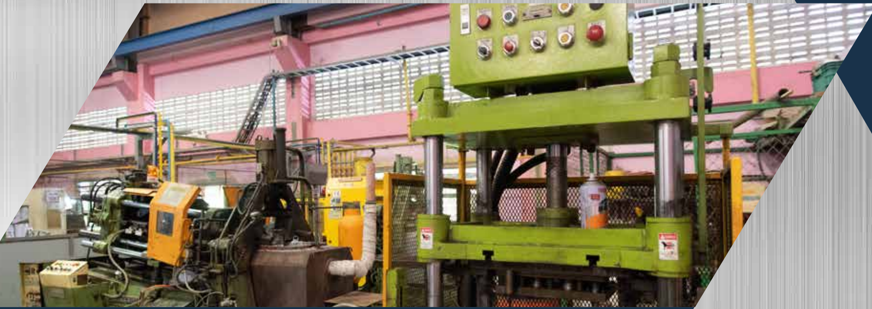
Producer 60 ton 2 sets