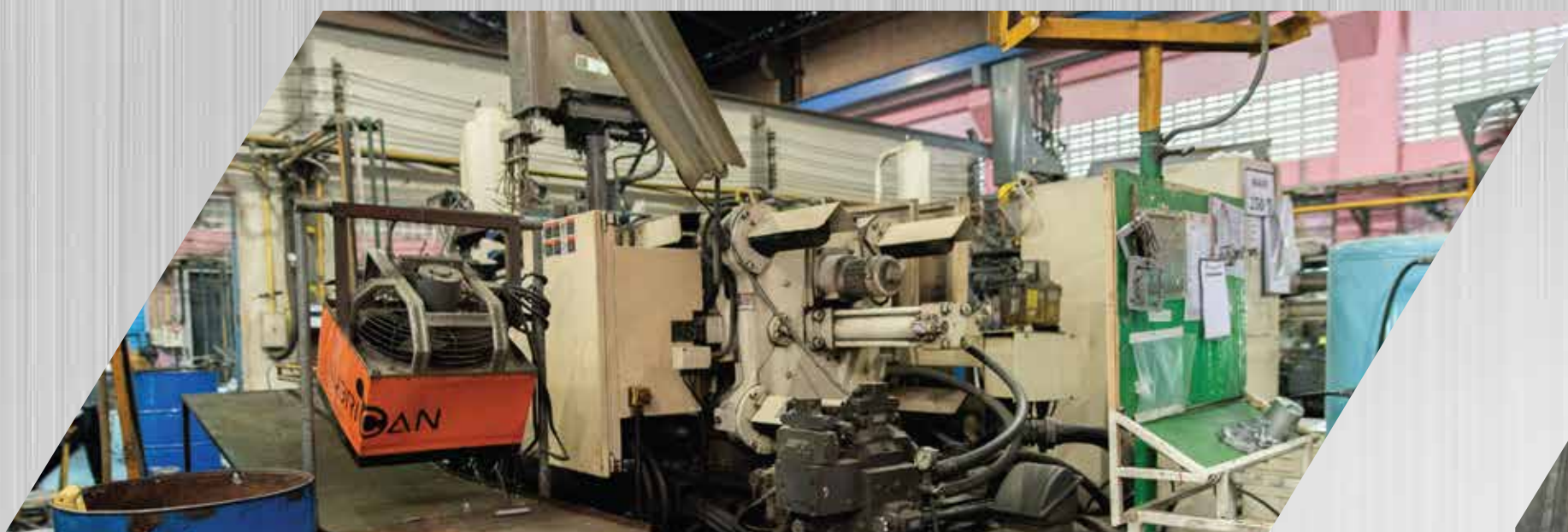
Toshiba 250 ton 1 set