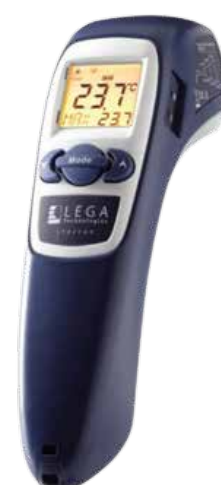
Digital Laser Thermometer