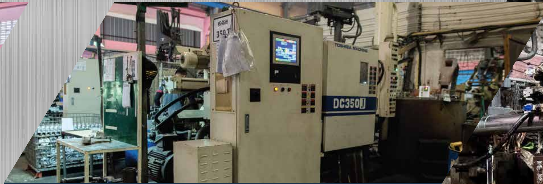
Toshiba 350 ton 4 sets